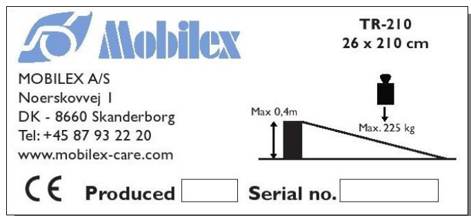
Abbildung des Typenschildes (Beispiel)

Das Typenschild befindet sich auf der Außenseite der Rampe