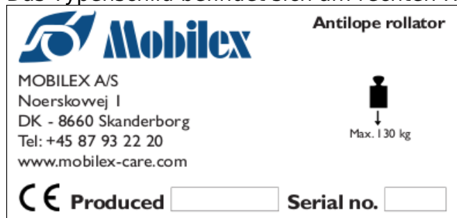
Abbildung des Typenschildes (nicht originales Beispiel)

Das Typenschild befindet sich am rechten Rahmenrohr vor dem Hinterrad.