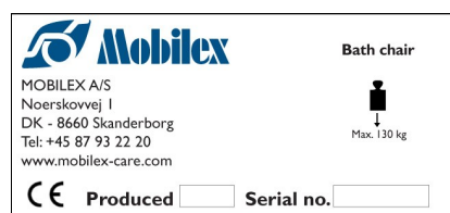
Abbildung des Typenschildes (Beispiel)

Das Typenschild befindet sich auf der Rückseite der Rückenlehne.