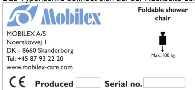
Abbildung 1: Typenschild ( nicht originales Beispiel)

Das Typenschild befindet sich auf der Rückseite der Rückenlehne.