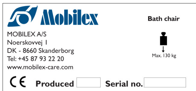
Abbildung des Typenschildes ( nicht originales Beispiel)

Das Typenschild befindet sich auf der Rückseite der Rückenlehne.