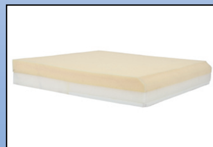
P4c. Viscoelastisk skum

Siddepude der er opbygget af et lag skum og et lag viskoelastisk skum. Komplet med inkontinensbetræk.