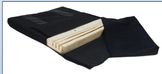
P3b. Siddepude med åbent betræk og pre-cut skum til dybdeindstilling

Universal i siddedybden justerbar kørestolspude af koldskum med sort inkontinensbetræk. Betrækket er udstyret med velcro og kan let åbnes. Pudene er lavet af koldskum, og er allerede udstyret med riller for dybdejustering af pudene til kørestolesædet. Skummet skæres til den ønskede dybde. Pudene leveres som standard med vores kørestol "Dolphin".