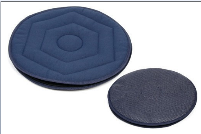
P6. Drejesæde mørkeblå med skridsikker underside Ø 45 cm eller Ø 50 cm.