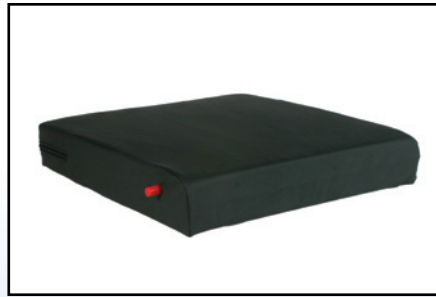
P6. Kørestolspude med ventil for regulering af luftindhold.

Mobilex luft-puden er udstyret med en speciel ventil, der tillader indstilling af ønsket lufttryk. Brugeren sætter sig på puden og udløser ventilen, hvorefter puden "indstiller" sig efter brugeren. Når ventilen lukkes fastholder ventilen formen og man opnår derved en optimal trykfordeling.