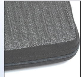
P2b. Skridsikker belægning

Pudene fås også med inkontinensbetræk i samme dimensioner og kan også leveres i specialmål efter aftale. Note: Ved større mængder, og mod en beskednen merpris kan pudene leveres med tryk efter aftale.