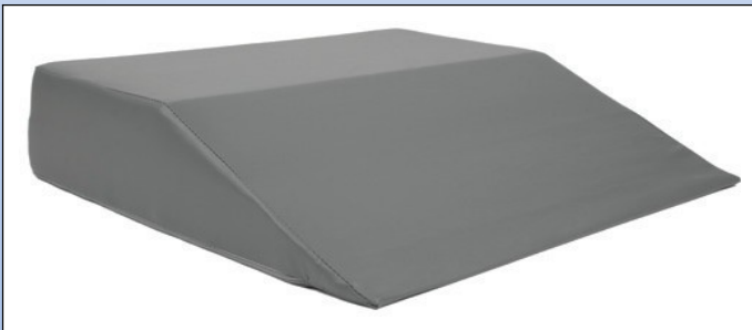
P7. Skråpude med gråt Decutex betræk

Diameter: 45 eller 50 cm Max. Belastning: 100 kg.