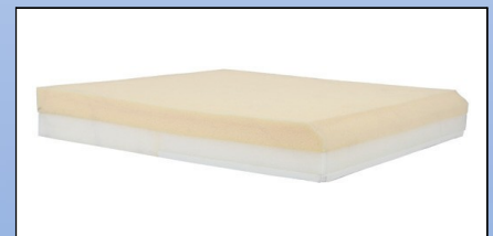
P4c. Viskoelastisk + PU skum

Kørestolspuden er opbygget med et lag viskoelastisk skum øverst og en almindelig koldskum nederst. Leveres komplet med inkontinens betræk, og skridsikker underside. Kan leveres i 5 størrelser fra 40 - 50 cm.