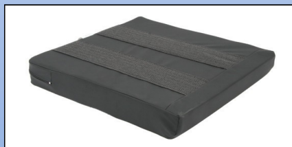
P4b. Underside med skridsikker belægning