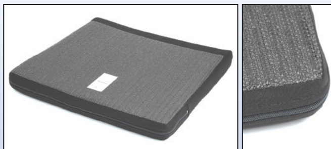
P2. Skridsikker belægning