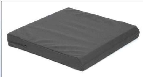
P2a. Kørestolspude med inkontinensbetræk