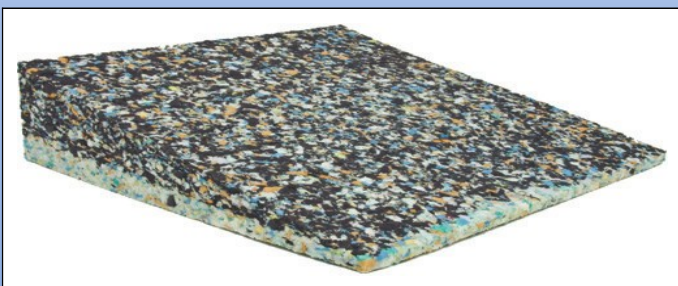
P8. Skråpude i granulatskum