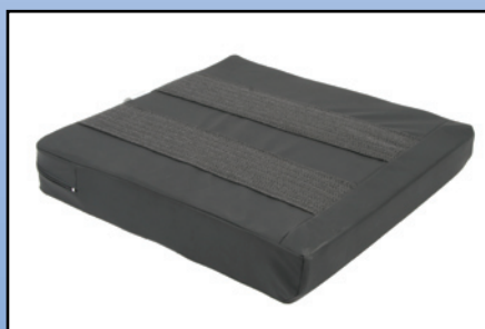
P4b. Underside med skridsikker belægning