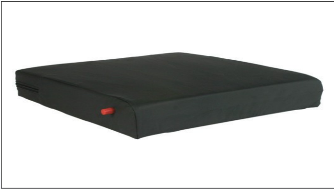
P5. Kørestolspude med ventil for regulering af luftindhold