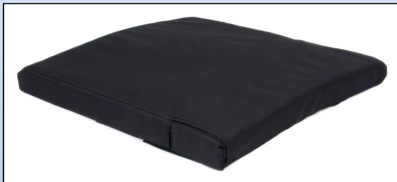
P3a. Universal pude med Inkontinensbetræk