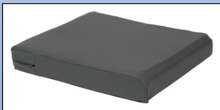
P4a. Pude med inkontinens betræk