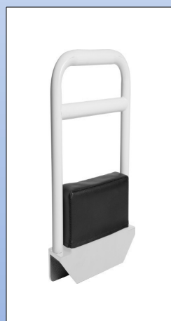
N5. Maniglia di sostegno per letti

Il maniglione di sostegno da letto è costruito in acciaio e viene fissato alla fiancata del letto tramite uno stabile supporto a morsetto. Per fiancate letto con uno spessore da 20-25 mm.