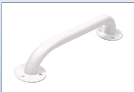
N3. Maniglione in acciaio ricoperto Rilsan®

I maniglioni d'acciaio sono ricoperti con materiale Rilsan®.