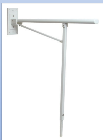
N4a. Maniglione ribaltabile con copertura Rilsan®