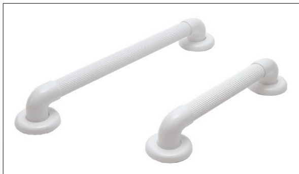
N1. Støttegreb i hvid PVC