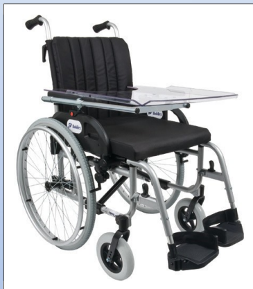
M2a. Terapibord i brug

Målet på plader er 57 cm x 38 cm (B x d) og kan forskydes 8 cm