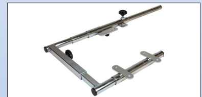
M2c. Montagebeslag for 240001