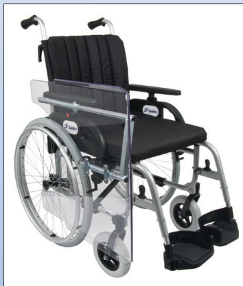
M2b. Terapibord nedklappet