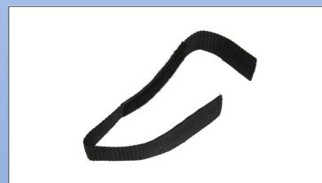
M3b. Velcrobånd for terapibord

Terapibordet kan leveres i 4 størrelser (B-D)