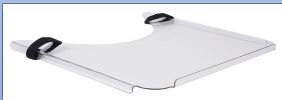
M3a. Terapibord med velcrobånd

Universal terapibord for montage på armlæn. Terapibordet er fremstillet i 4 mm brudsikkert, transparent materiale med kanter på 3 sider. Terapibordet er fastgjort på armlænen ved hjælp af to praktiske velcro bånd.