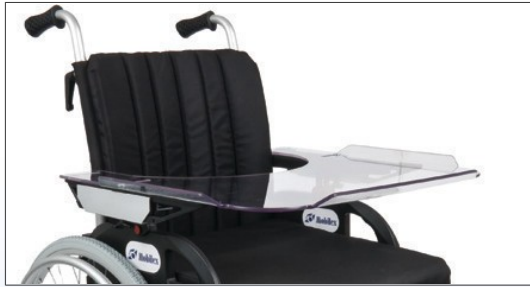
M1a. Universal terapibord monteret

Terapibordet er fremstillet i 6mm brudsikkert, transparent materiale med kanter på 3 sider. Kan indstilles op til 9 cm i bredden. Mobilex montage system kan indstilles for 28 - 58 mm polsterhøjde .