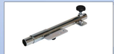
M2d. Armlænsbeslag for 240001