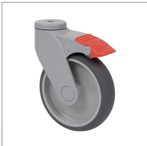
F7. Ruota girevole 100 mm / 125 mm con testa su cuscinetto p.e. per comode Aquatec