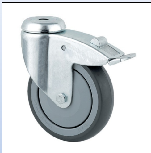
F4. Ruota girevole, testa su doppio giro di sfere, mod. 2477 con freno, asse con vite e dado

Ruota girevole con testa girevole su doppio giro sfere, asse rivettato, adatta per letti ospedalieri, lifter o carrelli di alto carico. Disponibile a magazzino: Ø 75 mm, Ø 100 mm o Ø 150 mm, con o senza freno.