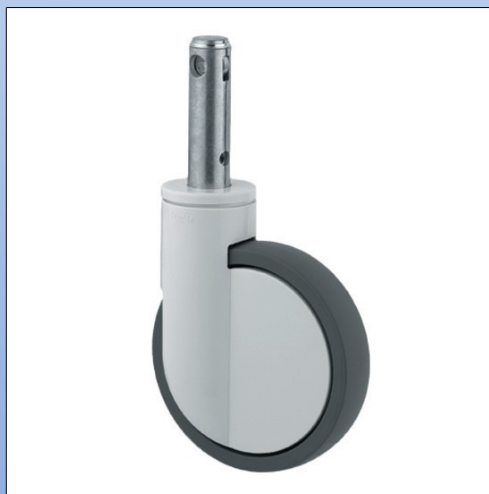
F6. Ruota girevole, mod. 2044/46

Ruote girevoli per letti ospedalieri fornibili con freno a bloccaggio totale o direzionale oppure in combinazione. Tutti i modelli sono fornibili anche in versione antistatica.