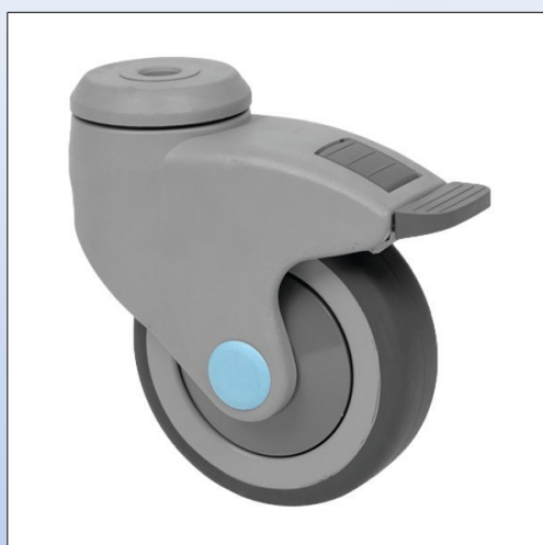
F9. Ruota in plastica mod. 5897 con freno, raggio di svolta ridotto, adatta p.e. per Lifter o similari