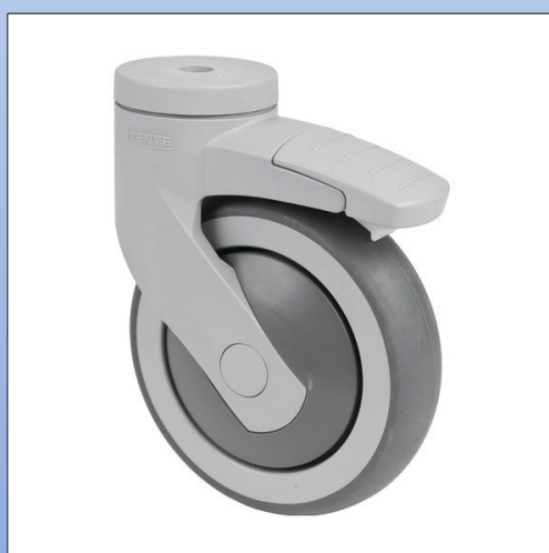
F11. Ruota girevole mod. 5387 con freno, adatta per comode da doccia ecc.