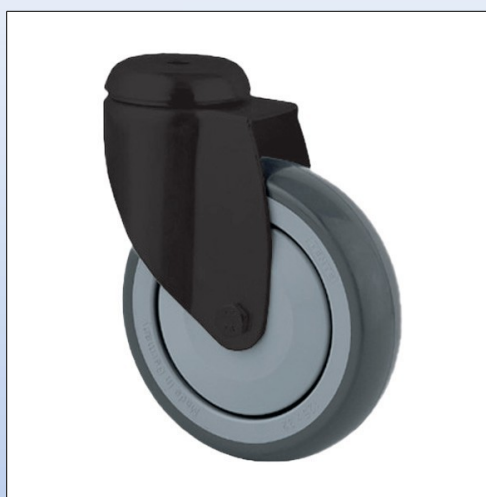
F10. Ruota girevole nera mod. 2740 con testa a cuscinetto, senza freno, p.e. per sedie VELA.