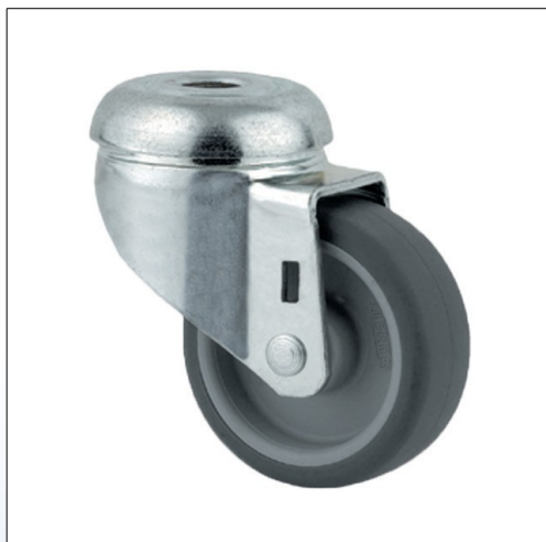
F1. Ruota girevole, testa su doppio giro di sfere, mod. 2470 senza freno, asse rivettato