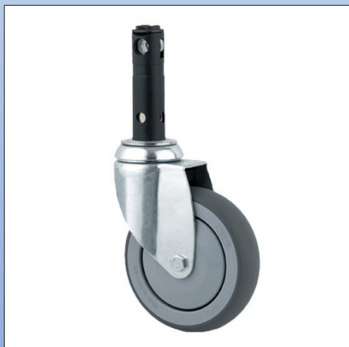
F5. Ruota girevole mod. 2474/76

Ruota girevole con testa girevole su doppio giro sfere, asse rivettato, adatta per letti ospedalieri, lifter o carrelli di alto carico. Disponibile a magazzino: Ø 75 mm, Ø 100 mm o Ø 150 mm, con o senza freno.