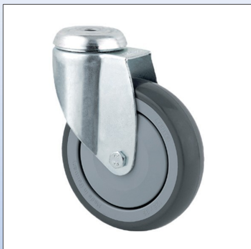
F3. Ruota girevole, testa su doppio giro di sfere, mod. 2470 senza freno, asse con vite e dado

Ruota girevole con testa girevole su doppio giro sfere, asse rivettato, adatta per letti ospedalieri o dispositivi simili di basso carico. Disponibile a magazzino in due modelli: Ø 50 mm e Ø 75 mm, con o senza freno.