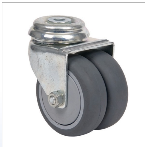
F8. Ruota girevole doppia mod. 2970 senza freno con testa su cuscinetto per Lifter o similari