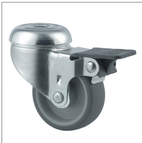
F2. Ruota girevole, testa su doppio giro di sfere, mod. 2475 con freno, asse rivettato

Ruota girevole con testa girevole su doppio giro sfere, asse rivettato, adatta per letti ospedalieri o dispositivi simili di basso carico. Disponibile a magazzino in due modelli: Ø 50 mm e Ø 75 mm, con o senza freno.